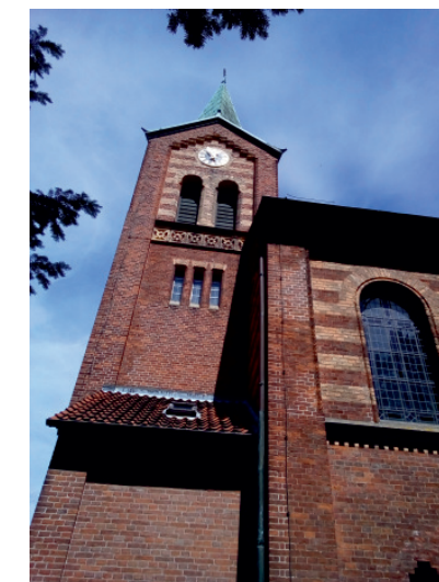
Wettmar: St. Marcus Kirche