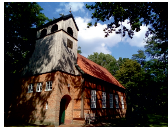
Fuhrberg: Ludwig Harms Kirche