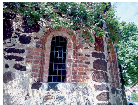
Engensen: Dorfkapelle (Fenster)