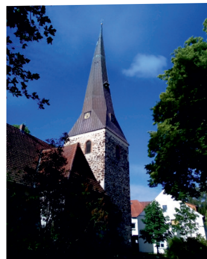
Großburgwedel: St. Petri Kirche