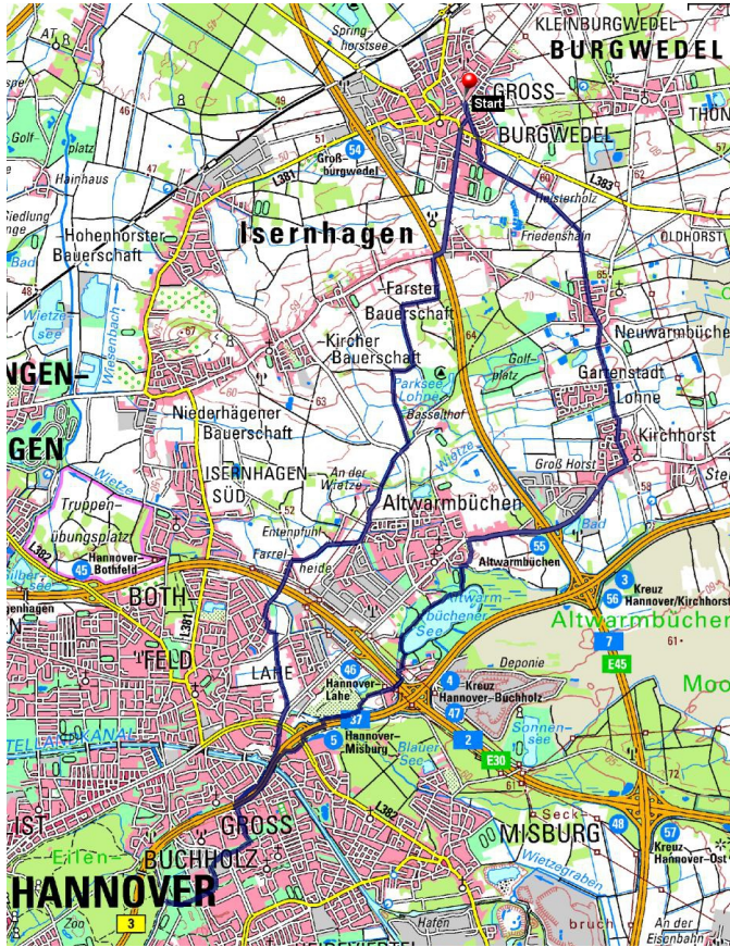
Beispiel für Pendler Routen von Burgwedel nach Hannover-Buchholz über verkehrsarme Straßen und Wirtschaftswege (ca. 50 min Fahrzeit).

Routenvorschläge für Alltagsradwege in die Nachbargemeinden finden Sie im Internet unter: