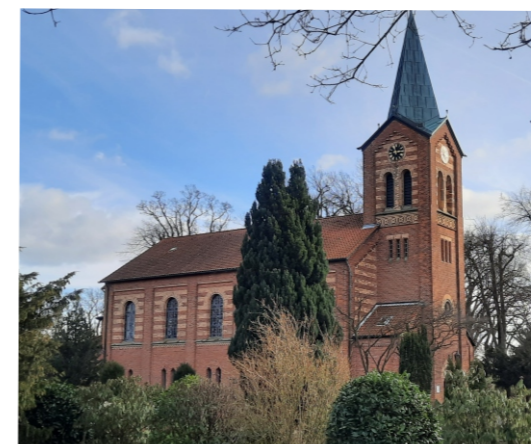
Wettmar: St. Marcus Kirche