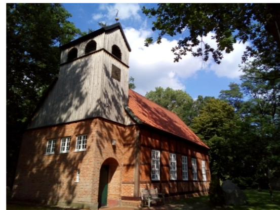
Fuhrberg: Ludwig Harms Kirche