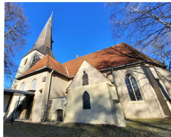
Großburgwedel: St. Petri Kirche