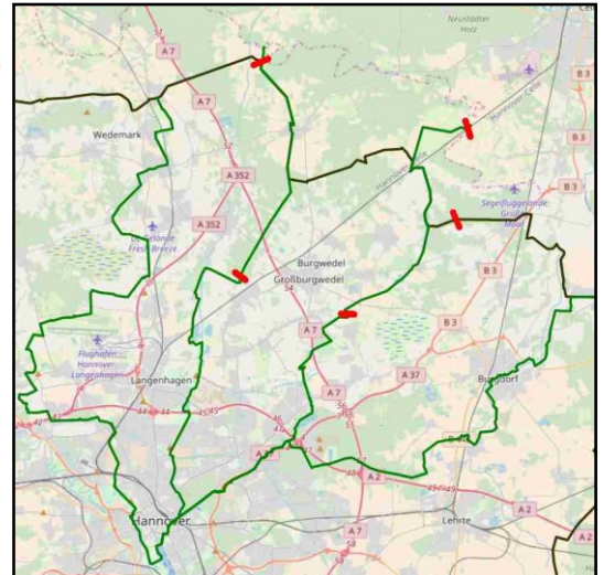
Regionsradwege im Bereich Burgwedel

Der ADFC wird an dem Info-Abend auch Bilder und Filme von Fahrten vergangener Jahre zeigen und Tipps zu Ausrüstung und Verpflegung geben. Für Fragen, Diskussion und lockeren Erfahrungsaustausch steht genügend Zeit zur Verfügung. Zu der Veranstaltung sind alle interessierten Bürgerinnen und Bürger eingeladen. Der Eintritt ist frei.