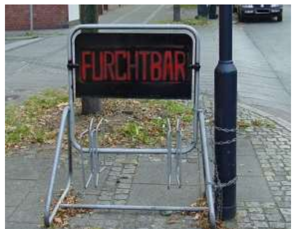
Ohne Worte

https://www.adfc.burgwedel.de/?page_id=739