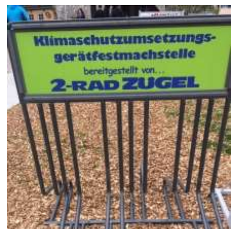
Felgenkiller mit Humor

P.S. Abmelden von diesen Rundbriefen durch eine formlose Mail an adfc.burgwedel@gmail.com